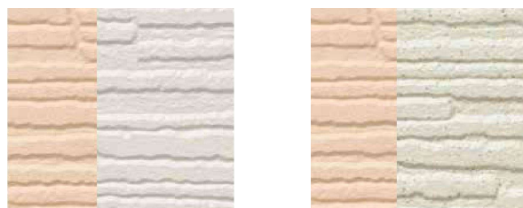
単色 → 単色

中塗りのベース色と、上塗りに配合した様々な大きさのカラーチップによって、多彩な色調を表現することができます。特に、単色のデザインサイディングは多彩に塗り替えることで美観をワンランクUPすることができます。