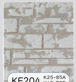
KF204 K25-85A K19-70B