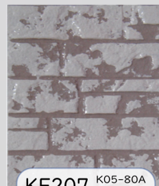
KF207 K05-80A K09-60B