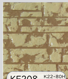
KF208 K22-80H K19-60H