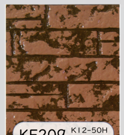
KF209 K12-50H K17-30F