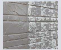
下地+上塗 | グラデーション工法