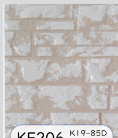
KF206 K19-85D K15-70H