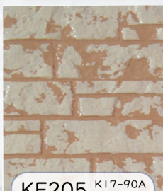
KF205 K17-90A K17-80C