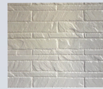
ベタ塗り 一般的に塗替えられる工法