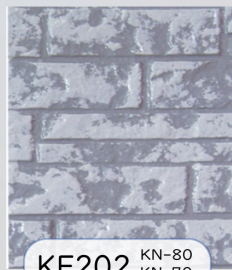
KF202 KN-80 KN-70